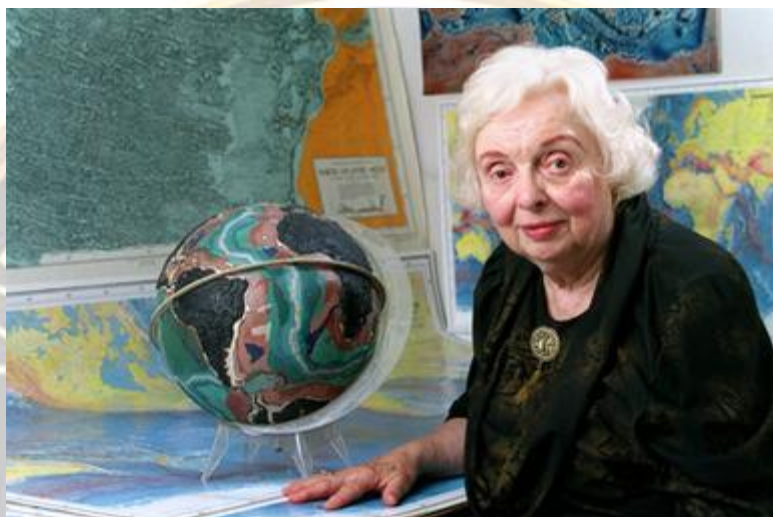
Foto de Marie Tharp em Julho de 2001